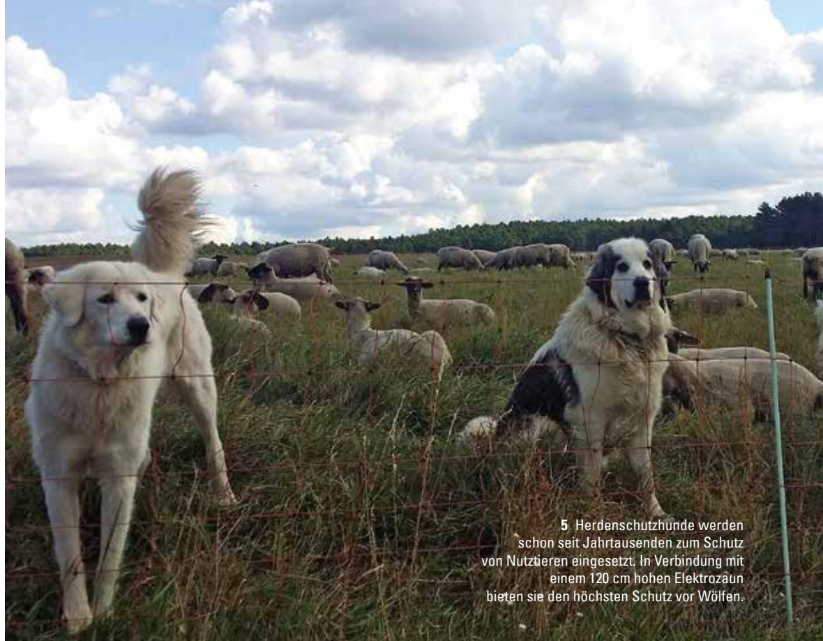
5 Herdenschutzhunde werden schon seit Jahrtausenden zum Schutz von Nutztieren eingesetzt. In Verbindung mit einem 120 cm hohen Elektrozaun bieten sie den höchsten Schutz vor Wölfen.

Gegensatz zu wild lebenden Paarhufern eine leichte Beute.